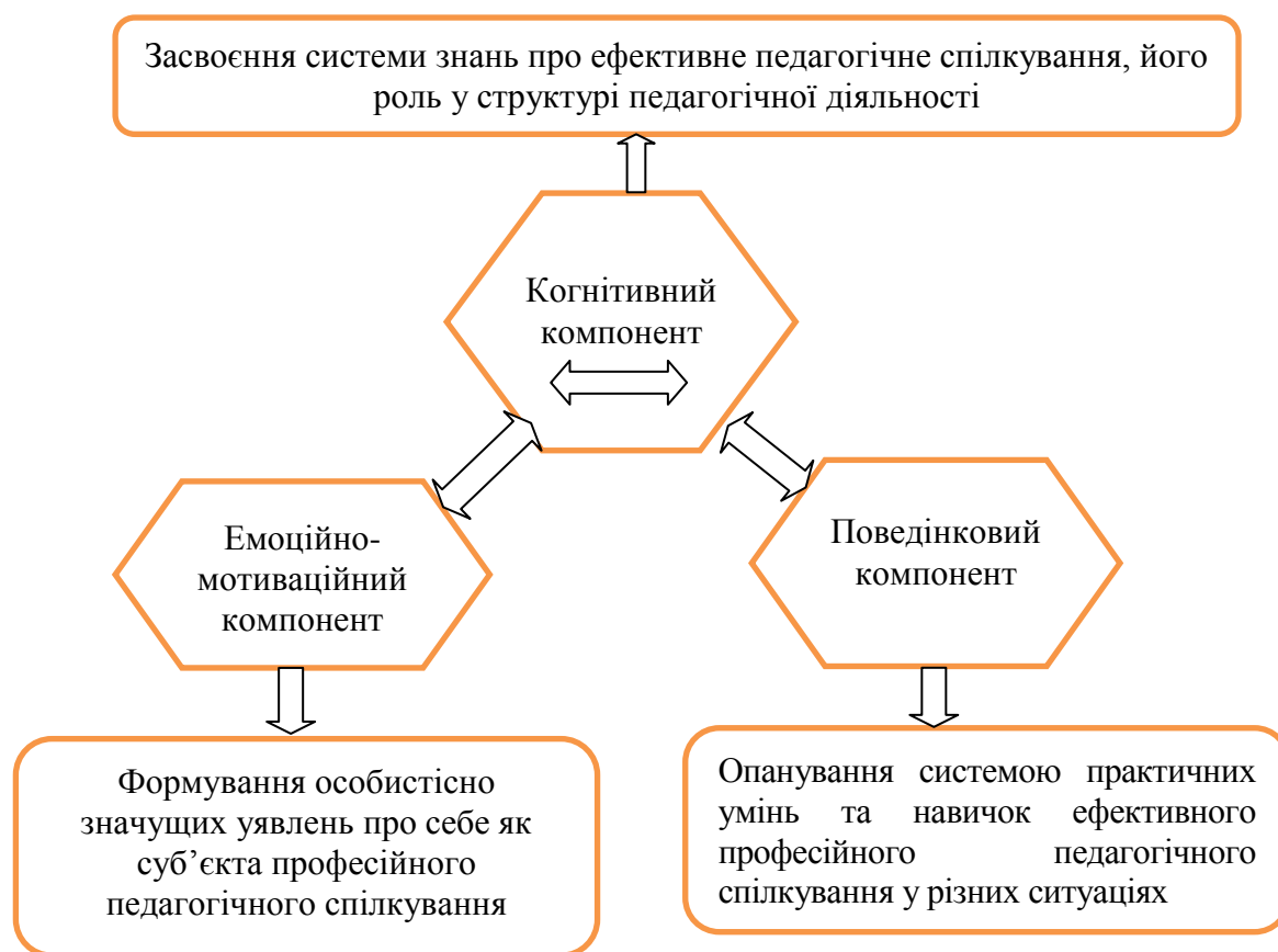
Рисуюнок 2 – Зміст тренінгу формування комунікативної компетентності майбутніх вчителів музики

На рис. 2 схематично зображено зміст тренінгу.