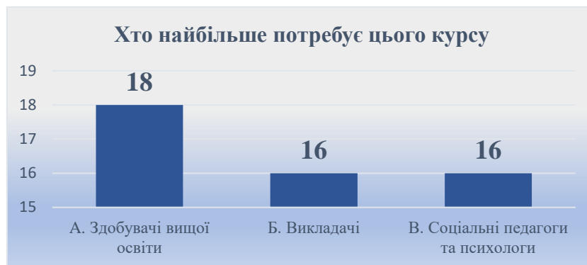
Рис. 5. Хто найбільше потребує цього курсу

Нарешті, щодо очікуваних результатів впровадження курсу, учасники анкетування могли обирати декілька варіантів. Найбільше респондентів — 80 % (40 осіб) — очікують підвищення рівня толерантності серед студентів. 70 % (35 осіб) вважають, що курс сприятиме покращенню взаємодії між усіма учасниками освітнього