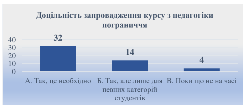
Рис. 2. Доцільність запровадження курсу з педагогіки пограниччя

(14 осіб) підтримують запровадження даного курсу, але лише для певних категорій студентів, тоді як 8 % (4 особи) вважають, що наразі це питання не на часі (рис. 2). Аналізовані дані свідчать про загальну позитивну налаштованість освітньої спільноти щодо важливості інтеграції тематики педагогіки пограниччя у освітній процес. Зазначене набуває все більшої актуальності в контексті зростаючої нині потреби формування інклюзивного середовища.