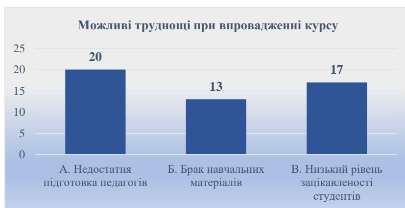
Рис. 4. Можливі труднощі при впровадженні курсу

матеріалів (26 % або 13 осіб), що показано на рис. 4. Отримані результати вказують на потребу в підвищенні кваліфікації викладачів, розробці сучасного методичного забезпечення та адаптації навчального контенту до потреб і мотивації здобувачів освіти.