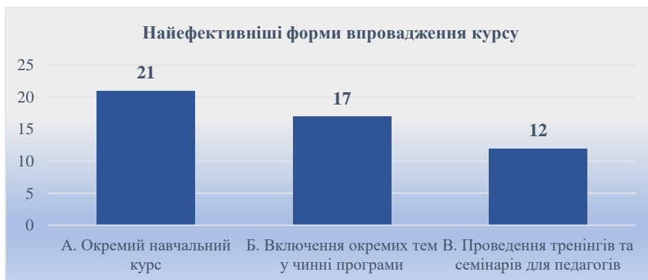
Рис. 3. Найефективніші форми впровадження педагогіки пограниччя

існують, а 24 % (12 осіб) вважають доцільними проведення тренінгів і семінарів для педагогів (рис. 3). Дані результати свідчать про розуміння необхідності гнучкого підходу до реалізації змісту курсу залежно від умов і цілей закладу освіти.