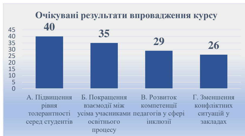
Рис. 6. Очікувані результати впровадження курсу

процесу. Натомість 58 % (29 осіб) прогнозують розвиток професійної компетентності педагогів у сфері інклюзії, а 52 % (26 осіб) — зменшення конфліктних ситуацій у закладах освіти (рис. 6). Таким чином, основні очікування зосереджені навколо формування толерантного освітнього середовища та покращення професійної взаємодії.