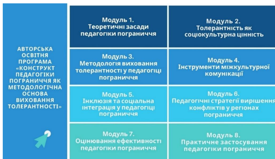
Рис. 7. Авторська освітня програма “Конструкт педагогіки пограниччя як методологічна основа виховання толерантності”

За результатами обговорення авторської освітньої програми “Конструкт педагогіки пограниччя як методологічна основа виховання толерантності” робочою групою було детально проаналізовано її структуру, змістове наповнення та перспективи впровадження в освітню практику. Учасники зазначили, що програма є своєчасною відповіддю на запит сучасної освіти щодо формування міжкультурної компетентності та толерантного світогляду, особливо в умовах багатокультурних регіонів. Вона охоплює вісім логічно взаємопов’язаних модулів, кожен із яких розкриває окремий аспект педагогіки пограниччя, включаючи теоретичні засади та особливості практичного впровадження.