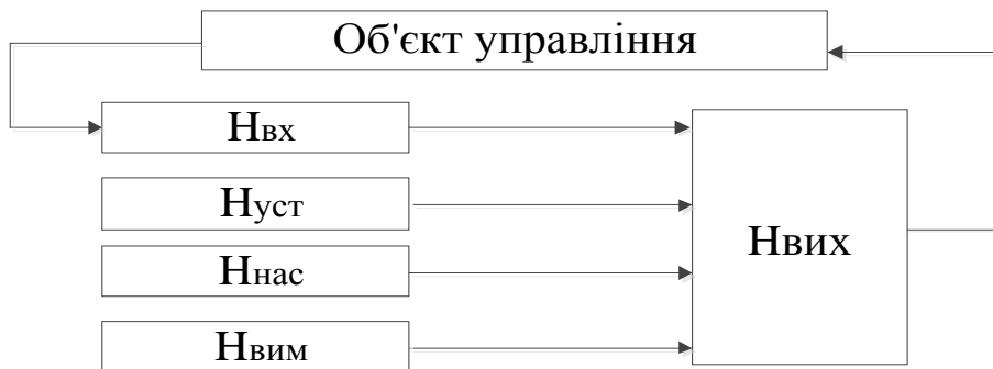
Рис. 2. Причинно-наслідкова модель системи знань про функціонування системи управління об'єктом енергосистеми