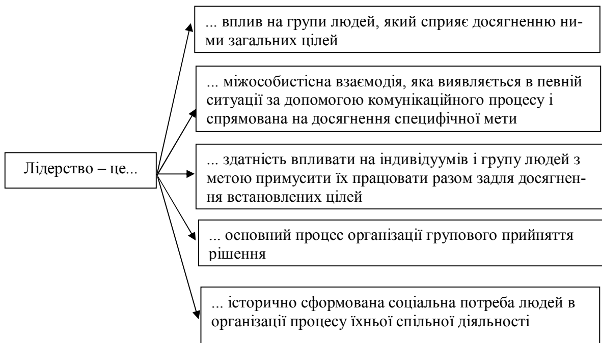
Рис. 1. Визначення поняття „лідерство”

Виклад основного матеріалу. В процесі вивчення проблеми лідерства вченими було запропоновано багато різних визначень цього поняття [1]. Наведемо деякі з них у рис. 1: