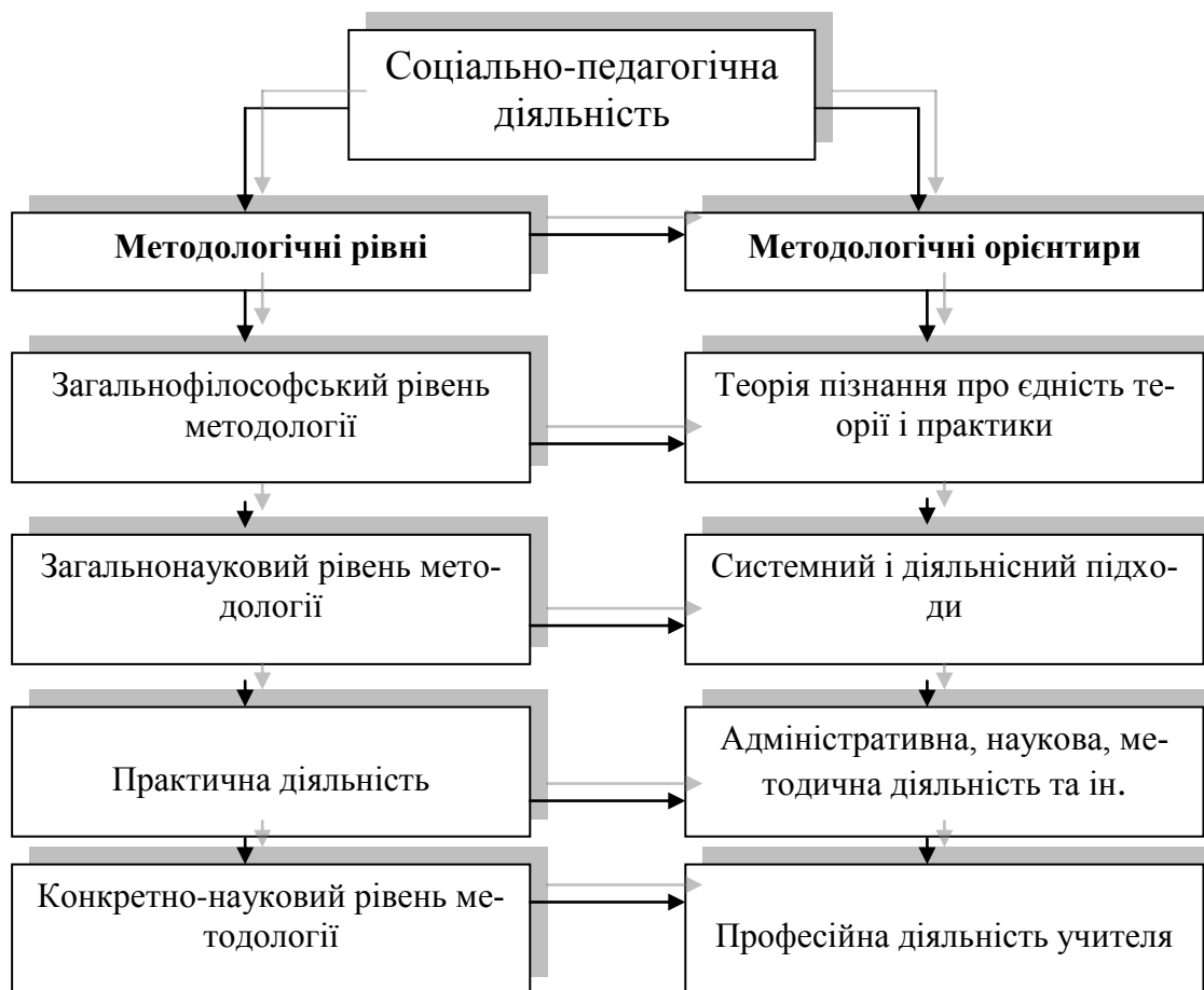
Рис. 1. Методологічні рівні дослідження соціально-педагогічної діяльності (згідно із теорією В. Краєвського)

На основі методологічного принципу пізнання реальної дійсності про єдність теорії і практики вдаємося до проектування соціально-педагогічної діяльності на тлі відповідного середовища (рис. 2).