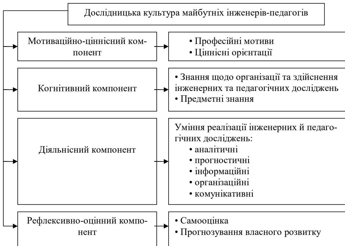
Рис. 2. Структурні компоненти дослідницької культури майбутніх інженерів-педагогів

інформаційних, організаційних та комунікативних умінь і навичок реалізації інженерних й педагогічних досліджень. Рефлексивно-оцінний компонент поєднує у собі рефлексію, самооцінку, прогнозування власного розвитку, є сукупністю суб'єктивних оцінок, пов'язаних з певними методиками професійно-спрямованої дослідницької діяльності майбутніх інженерів-педагогів.