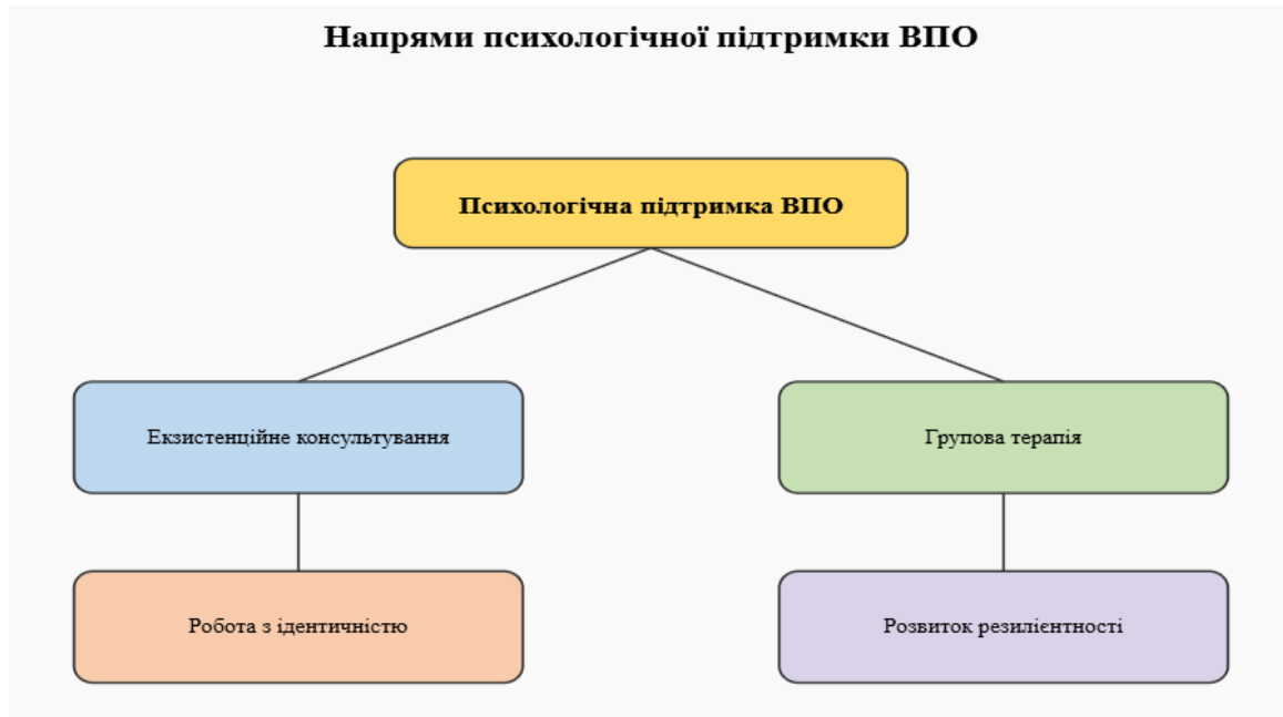
Рис. 3. Модель психологічної підтримки

На рисунку 3 представлено систему психологічної підтримки внутрішньо переміщених осіб, спрямовану на подолання екзистенційної самотності.