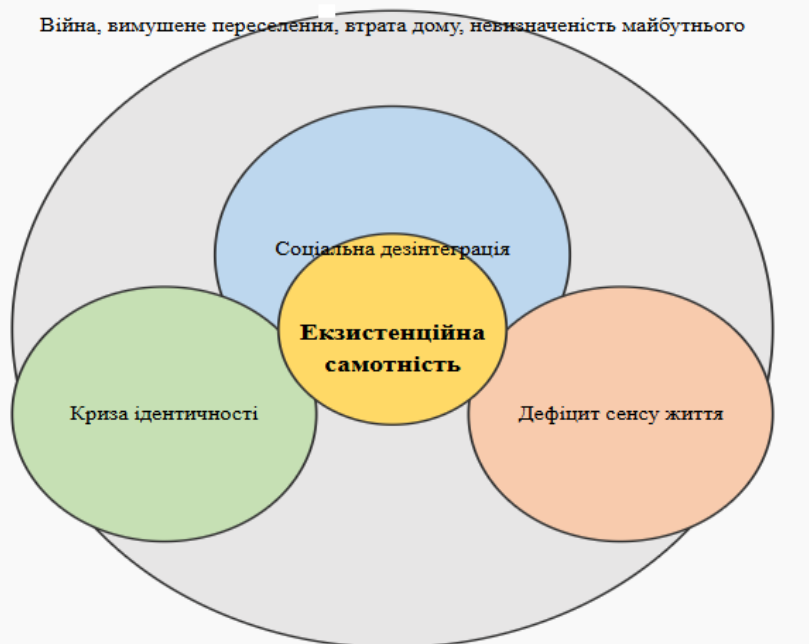
Рис. 2. Структурна модель екзистенційної самотності внутрішньо переміщених осіб

На рисунку представлено багаторівневу структурну модель екзистенційної самотності внутрішньо переміщених осіб в умовах війни.